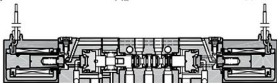
三位五通双电结构原理图（中封、中泄、中压）