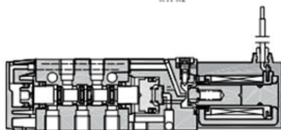
两位五通单电结构原理图